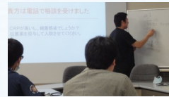
自分の思考がわかる診断学